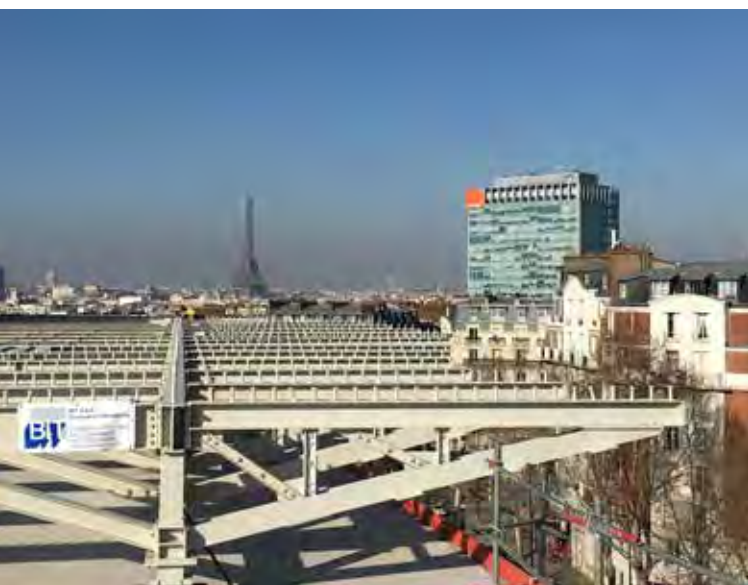
Hotel - Parigi