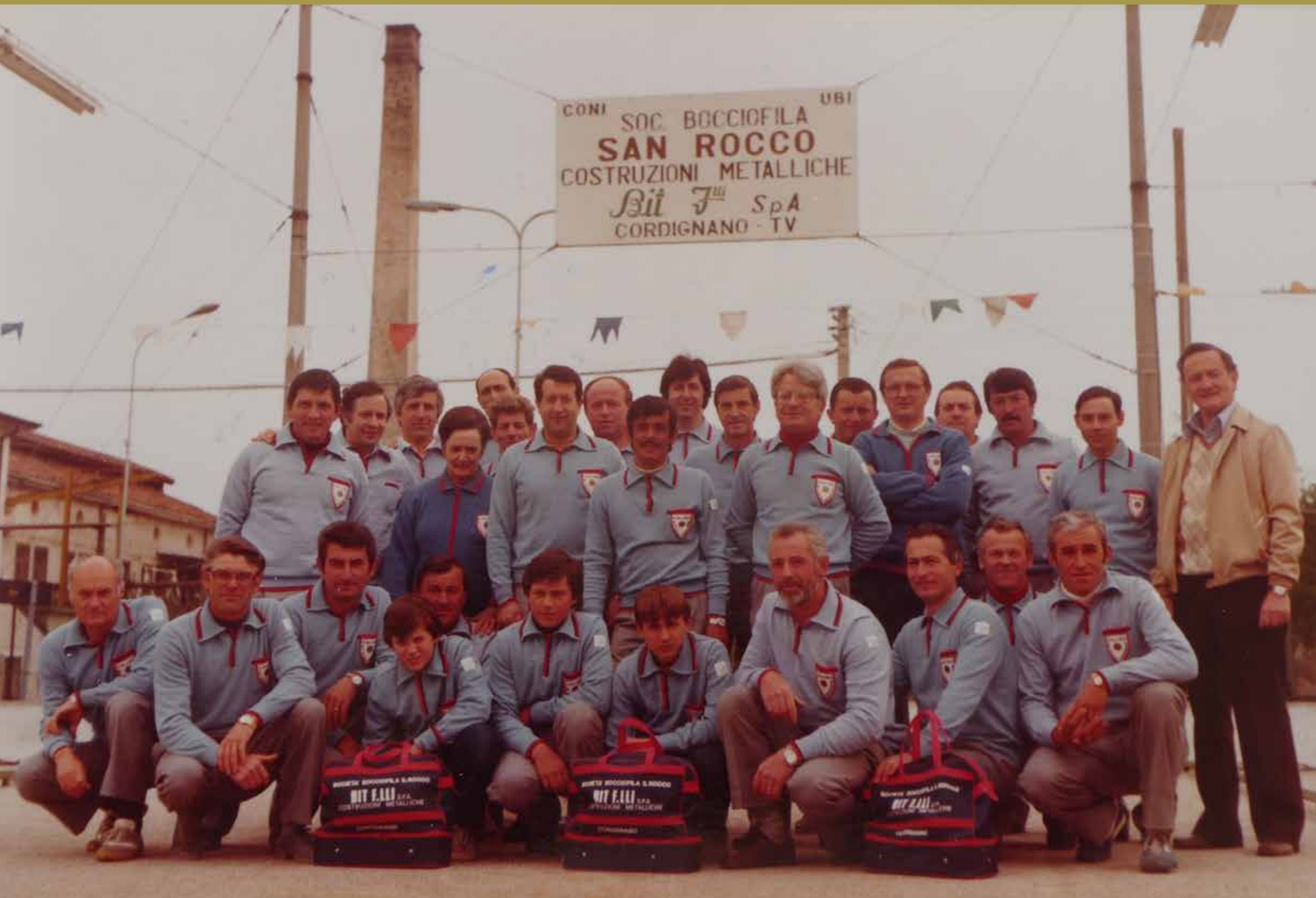
Anni Ottanta, foto di gruppo.