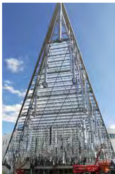
Padiglione Versailles - Parigi