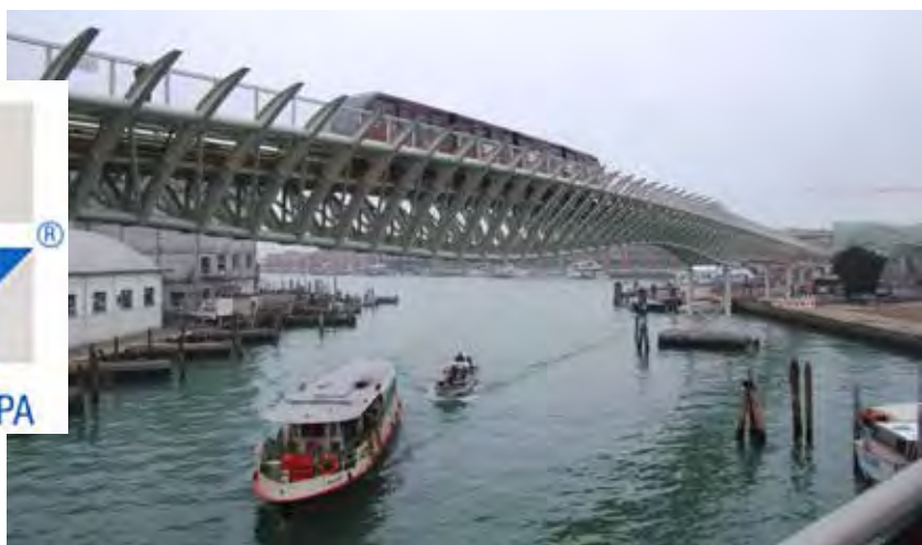
People Mover - Venezia