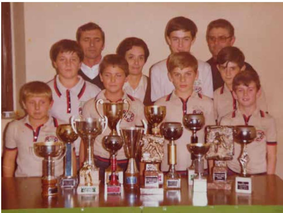
Il gruppo dei giovani che militavano nelle categorie giovanili negli anni Ottanta.

mente, sul finire del primo decennio del nuovo millennio, ma, per causa di forza maggiore, l'iniziativa ebbe termine nuovamente pochi anni dopo e il gruppo dei giovani venne indirizzato ad un'altra società. Nonostante l'indebolimento della categoria, in entrambi i periodi i giovani talentuosi si resero partecipi nell'incrementare i trofei sociali, conseguendo molteplici vittorie e piazzamenti nei vari tornei di categoria.