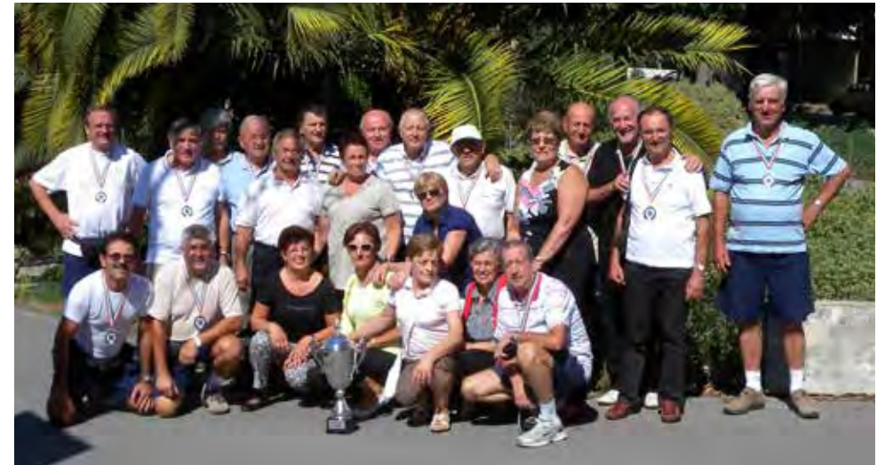
Settembre 2010; Roverino (Liguria), 3 o classificati al Campionato Italiano per società.