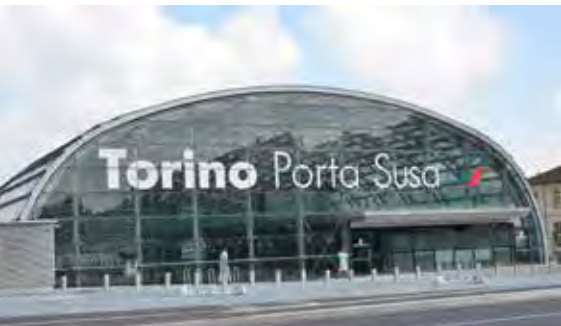
Stazione ferroviaria AV - Torino, Porta Susa