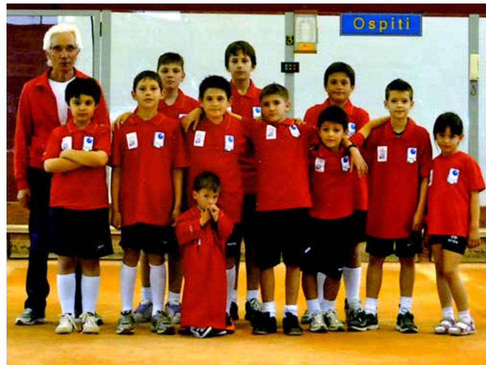
I giovani appartenenti alle categorie giovanili del nuovo Millennio.

mente, sul finire del primo decennio del nuovo millennio, ma, per causa di forza maggiore, l'iniziativa ebbe termine nuovamente pochi anni dopo e il gruppo dei giovani venne indirizzato ad un'altra società. Nonostante l'indebolimento della categoria, in entrambi i periodi i giovani talentuosi si resero partecipi nell'incrementare i trofei sociali, conseguendo molteplici vittorie e piazzamenti nei vari tornei di categoria.