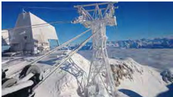
Torri sostegno cabinovia Pic de Bur - Francia