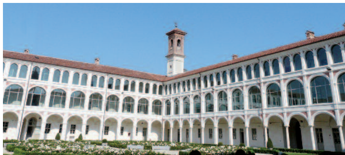
Ex convento di Santa Monica ora sede dell'Università