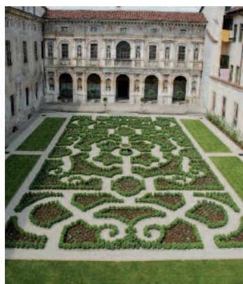
Palazzo Muratori Cravetta