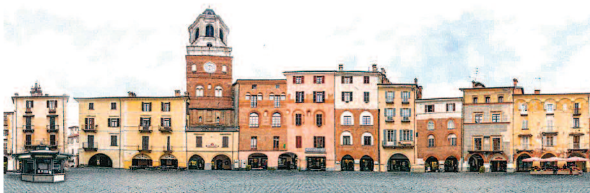
Vista panoramica di Piazza Santarosa