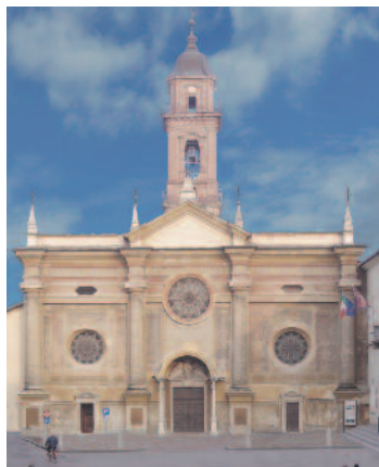
La chiesa di San Pietro

Scopri MÚSES – ACCADEMIA EUROPEA DELLE ESSENZE nelle sale barocche di Palazzo Taffini d'Acceglio: il museo che racconta il mondo delle erbe officinali e l'arte profumiera attraverso video installazioni, strumentazioni d'epoca e le opere d'arte di prestigiosi artisti internazionali.