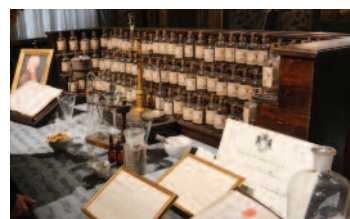
Múses, Accademia Europea delle essenze