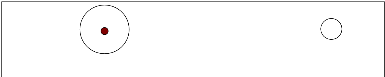
Figura 2: Il pallino è lungo la linea di demarcazione del campo. Il cerchio obiettivo è tangente alla linea di demarcazione