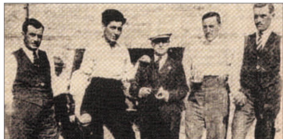
Gli azzurri si allenano sui campi di Charrenton alla vigilia delle Olimpiadi parigine