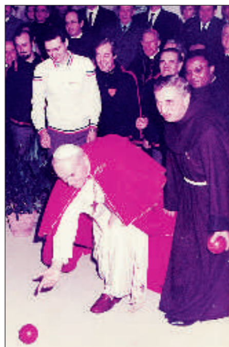
Papa Wojtyla al Circolo San Tarcisio di Roma