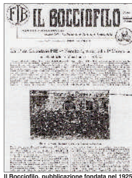
Il Bocciofilo, pubblicazione fondata nel 1925