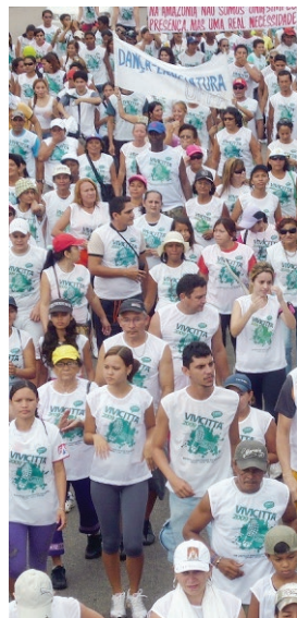
Immagine da un Vivicità