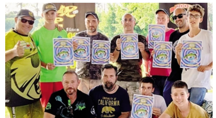
I concorrenti premiati al 19° Pike Fishing Tournament al lago Arcadia