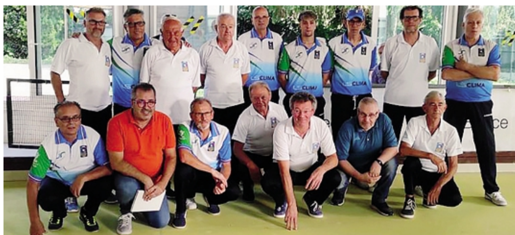
La formazione della Junior Rogno (in maglia biancazzurra) con gli avversari dell'Agrate Conturbia

Gli sfidanti si sono qualificati alla nuova fase vincendo il derby con l'altra squadra di Rovigo, la Boara Polesine. Le due società avevano affrontato lo stesso girone di qualificazione chiudendolo con lo stesso punteggio frutto di quattro vittorie, un pareggio e una sconfitta a testa. Proprio come era