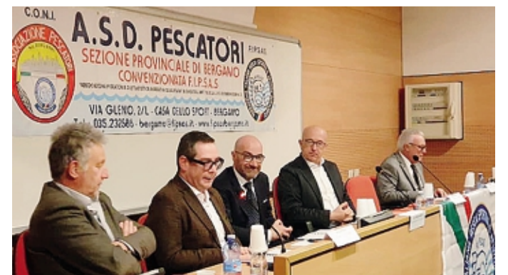
L'assemblea provinciale dell'Associazione Pescatori Fipsas nel 2023