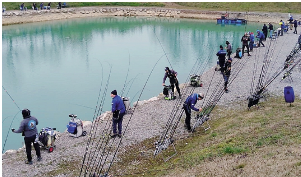
Il laghetto al Tiro di Martinengo sarà teatro della seconda prova dei Campionati provinciali della trota lago

È già tempo di tornare sui campi gara per gli appassionati della pesca sportiva bergamasca. Si parte domenica, 11 febbraio, in netto anticipo rispetto agli ultimi anni, con il via dei Campionati provinciali della specialità trota lago. Appuntamento al lago Nettuno di Romano di Lombardia, con la primagara del torneo individuale, aperto alla Prima e Seconda serie, Master e Veterani, nell'evento che aprirà ufficialmente la stagione e sarà organizzata dalla Mrl Trout. Dopo il primo impegno, già la settimana seguente ci sarà la seconda prova al Tiro di Martinengo a cura del Triangolo Martinenghese: il campionato si concluderà poi il 24 novembre al lago Nettuno di Romano di Lombardia a cura della Calventianum.