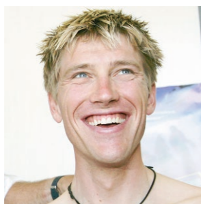
Axel Merckx, 44