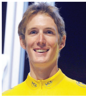
Andy Schleck, 31