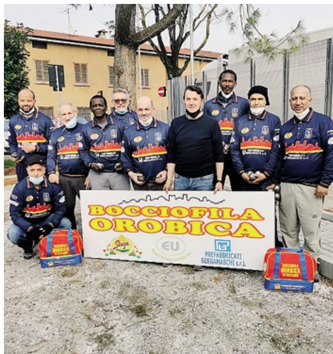
Alcuni giocatori di petanca affiliati all'Orobica Slega

Quella della petanca è, fra le specialità bocciola, la più diffusa al mondo. Più dell'80% dei boccioli di ogni paese si dedica a