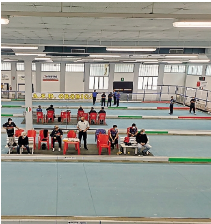
Il Centro federale di Bergamo domenica ospiterà una gara regionale

In Terza categoria Bergamo un po' sorride e un po' no; se nel girone 2 Presezzo domina, nel 3 l'Orobica Ottica Arrigoni arancia. La formazione della Polisportiva Presezzo raccoglie la seconda vittoria (6-2 in casa della Galimberti) e si porta a quota sei accanto proprio agli