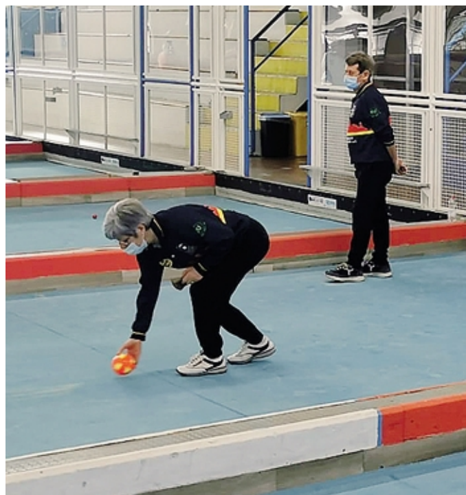
Una fase di gioco del campionato promozionale Lui & Lei

La prossima tappa, invece, si disputerà fra meno di un mese (il 28 marzo) a Lecco, sulle corsie della Fratelli Figini. Poi il Campionato girerà la Lombardia toccando nell'ordine Milano, Mantova, Varese, Monza Brianza, per