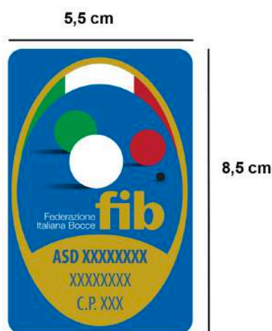
FIGURA N 1

Tutte le diciture sono di colore blu (blu federale).