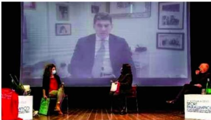
Le immagini della seconda giornata dell'evento

L'iniziativa è a cura dell'Amministrazione Comunale in sinergia con il Comitato Paralimpico Italiano Abruzzo e la società sportiva Go Fast. Fino a venerdì 23 ottobre a Pineto ci saranno appuntamenti dal carattere sportivo e culturale con numerose testimonianze, la presenza di ospiti noti, dimostrazioni legate a varie discipline sportive e riflessioni sul tema della disabilità con particolare attenzione alle storie di persone che sono riuscite a trasformare un apparente limite in grande punto di forza per costruire un percorso professionale