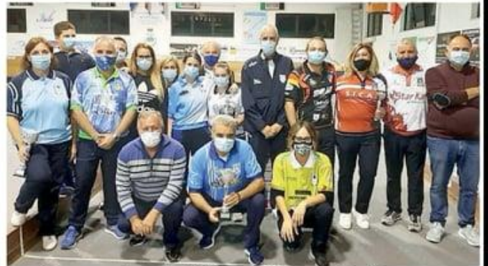
Foto di gruppo per i premiati della gara di bocce "Lui&Lei" a Roseto