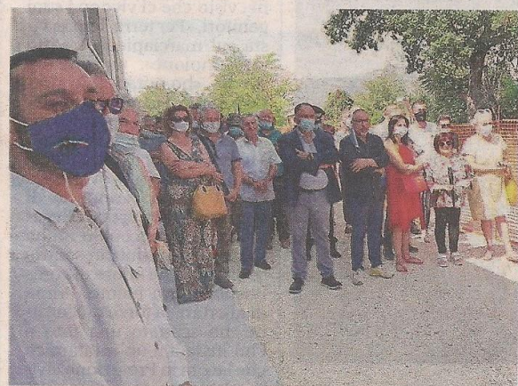
L'inaugurazione del bocciodromo di Paganica

nazione di un consiglio di circoscrizione di Pescara che li aveva raccolti per l'allora circoscrizione di Paganica (presidente Ugo De Paulis ) che li ha poi girati al circolo bocciodromo. C'era tanta gente, ieri mattina, all'inaugurazione. Oltre all'intervento di Ciammetti ci sono stati quelli dell'onorevole Stefania Pezzopane , del vicepresidente del consiglio regionale Roberto Santangelo , dell'assessore comunale Daniele Ferella , dell'ingegnere Dino Iovannitti , di Gregorio Gregori , commissario straordinario Fib Abruzzo (Federazione