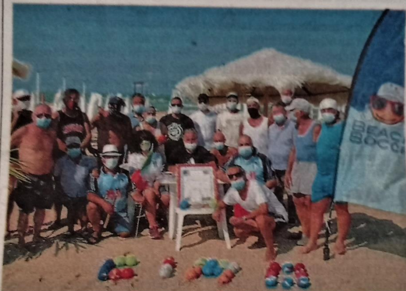
Foto di gruppo dell'ultima tappa del Beach Bocce Tour a San Salvo