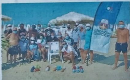
Foto di gruppo alla tappa di Beach Bocce di San Salvo